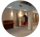
Ex : cabanes dans le couloir

Avec le recul (espaces ouverts depuis avril 2021), on peut observer que les différents choix d'espace de travail permettent différentes postures , le travail de groupe est favorisé et le climat scolaire apaisé .