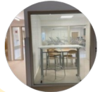
Ex : salle attenante